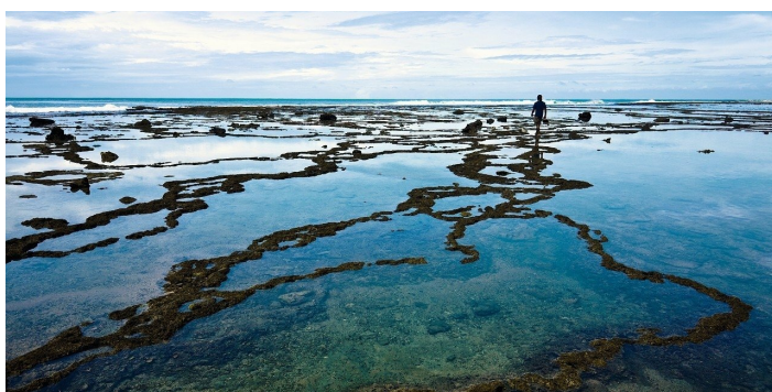
Carl Zeiss T* UV filter