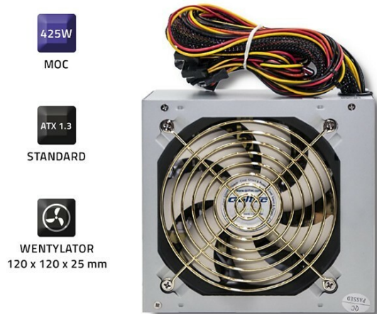
ZASILACZ ATX SILENTLINE 425W