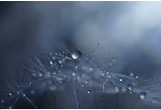
G Lens Bokeh