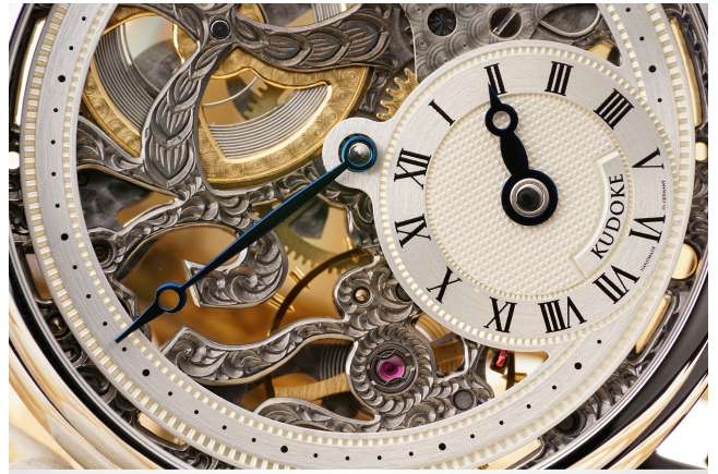
Image-wide Clarity from Macro to Infinity