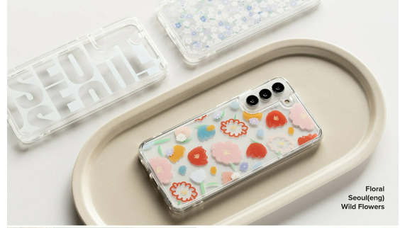
Floral Seoul(eng) Wild Flowers