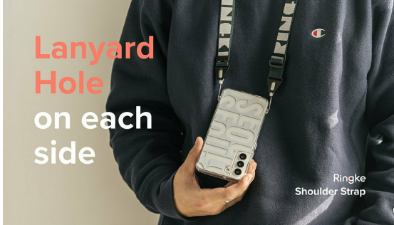
Ringke Shoulder Strap