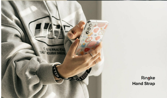
Ringke Hand Strap