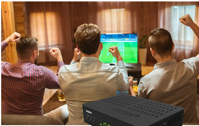
Linux Combo Receiver S2+T2/C H.265/HEVC 10 Bit