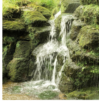
without B+W ND Vario Filter