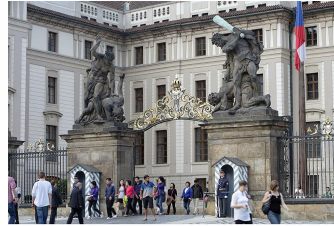
without B+W ND Vario Filter