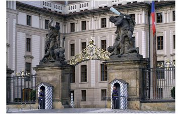
with B+W ND Vario Filter